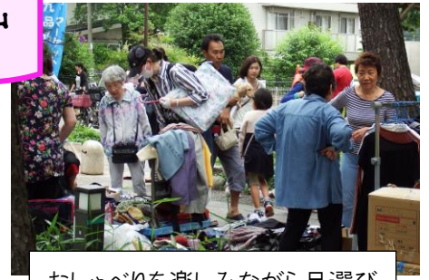
おしゃべりを楽しみながら品選び