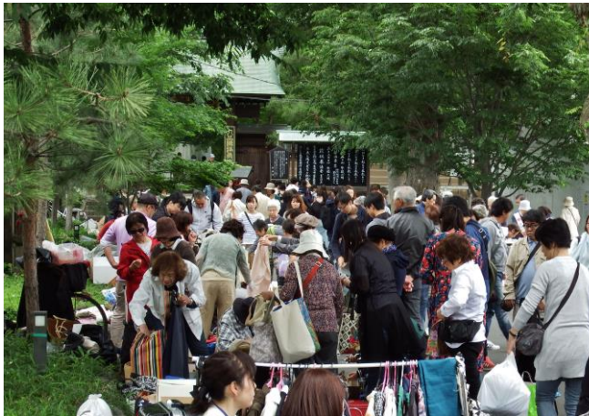
空模様の怪しい中、予定より30分早く開店。人出が心配でしたが、総門前も盛況でした。閉店の午後2時を待っていたかのように雨が降り始めました。

今年は剣玉と輪投げ(スポーツ輪投げ)ができる「遊び場」を総門前に開きました。子供達を楽しめるようにと、企画したものです。特に輪投げが好評で、中には1点から9点の全ての棒に一個ずつ輪を投げ入れてパーフェクトを記録したお子さんもいました。順番待ちしながらのぞき込む姿が微笑ましかったです。