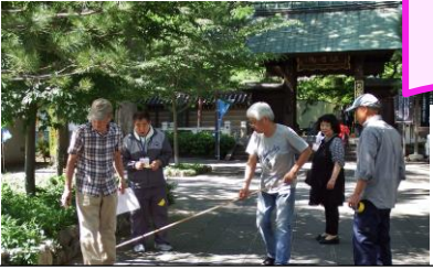
前日は、スタッフ総出で会場準備。 これは、売り場の区割り作業