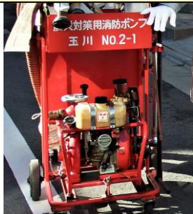
赤い専用カートに固定されたD型ポンプ本体

このポンプの作動に興味がある方・協力したいと思う方は、是非理事に声をかけてください。