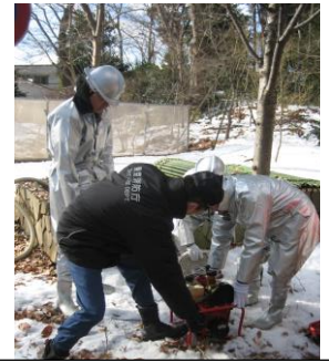
事前練習でD型ポンプのスターターをひきエンジンをかける区民消火隊

気温4度の晴天の下、「開山堂で火災発生、けが人あり」という設定で実施。訓練状況を逐一伝えるアナウンスを聞きながら、残雪と落ち葉を踏みしめて参加。集まった保育園児らの声援を受け、お坊さんが「火事だ！」の声で周囲に知らせ、消火器を噴射してダミー人形を救出。その後玉川消防署奥沢出張所、浄真寺自衛消防隊、玉川消防団第2分団、東京消防庁災害時支援ボランティア、そして九品仏自治会の区民消火隊(自治会)の各チームが消火演習を行い、クライマックスは青空に向けて一斉放水。並んだ水柱に見事な虹が架かりました。