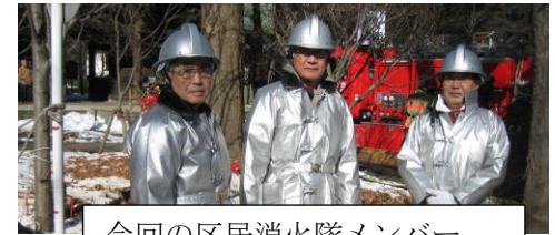
今回の区民消火隊メンバー (自治会理事チーム)