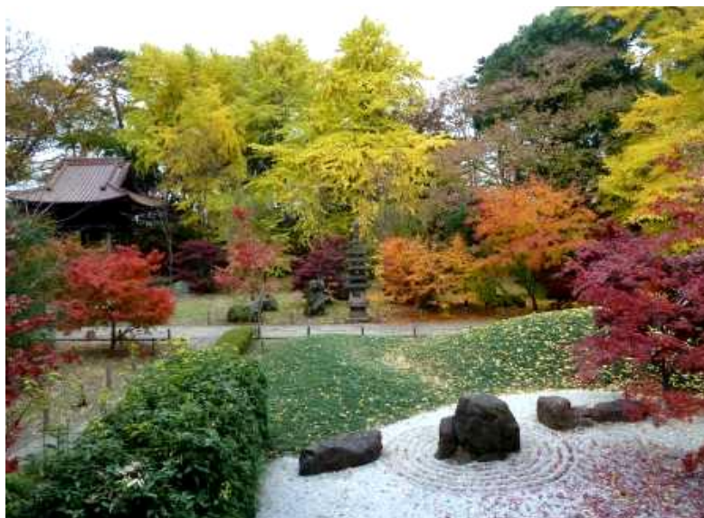
本堂からの眺め 左端は鐘楼

最後は開山堂の応接室で温かいお茶を頂いて帰りました。師走の午後のひと時でしたが、ほっと心の和む時間を皆さん過ごすことができたようです。