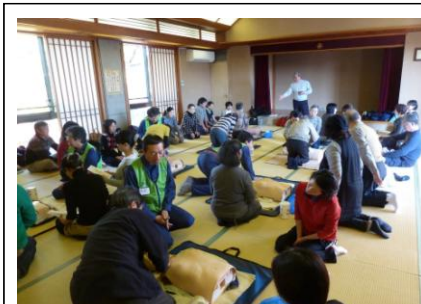
大広間での講習風景

2月8日(土)九品仏地区会館2階大広間で普通救命講習が開かれました。心肺蘇生方法や気道異物除去方法、止血方法など、いざと言うとき非常に重要で役立つことを教えてもらいました。心肺蘇生方法は実際にやってみて自信がつけました。まずは知ること。ご家族のためにもみなさん一度は講習を受けておくと良いと思いました。 A.Y.