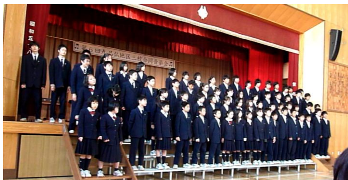
八幡中学校有志の合唱

さぎそう学舎*（八幡小、九品仏小、八幡中）・・・「世田谷9年教育」のパイロット校として小・中学校での連携を中心とした活動に取り組んできました。