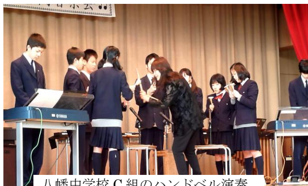
八幡中学校 C組のハンドベル演奏