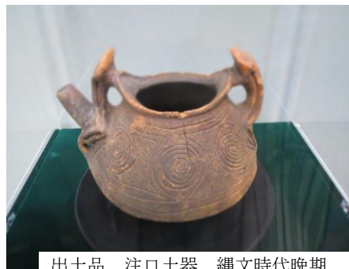
出土品 注口土器 縄文時代晩期

地図の矢印が九品仏川(現在の緑道)の方角で、点線で囲まれた部分は、現在の6丁目の丘の頂上一帯から玉川田園調布2丁目付近です。東西250㍍、南北350㍍ほどの地域です。家の建て替えなどで地下の掘削工事をする際に、区が遺跡調査をして来ました。発掘できた面積はほんの一部ですから、実際には数百世帯が暮らしていたのではないのでしょうか。発掘途中の遺跡の写真と説明書きから、住居の奥の方に大型土器を利用した炉(いろり)があり、その周囲に石を敷き詰めてある様子がわかりました。ささやかな展示でしたが、興味深く見てきました。